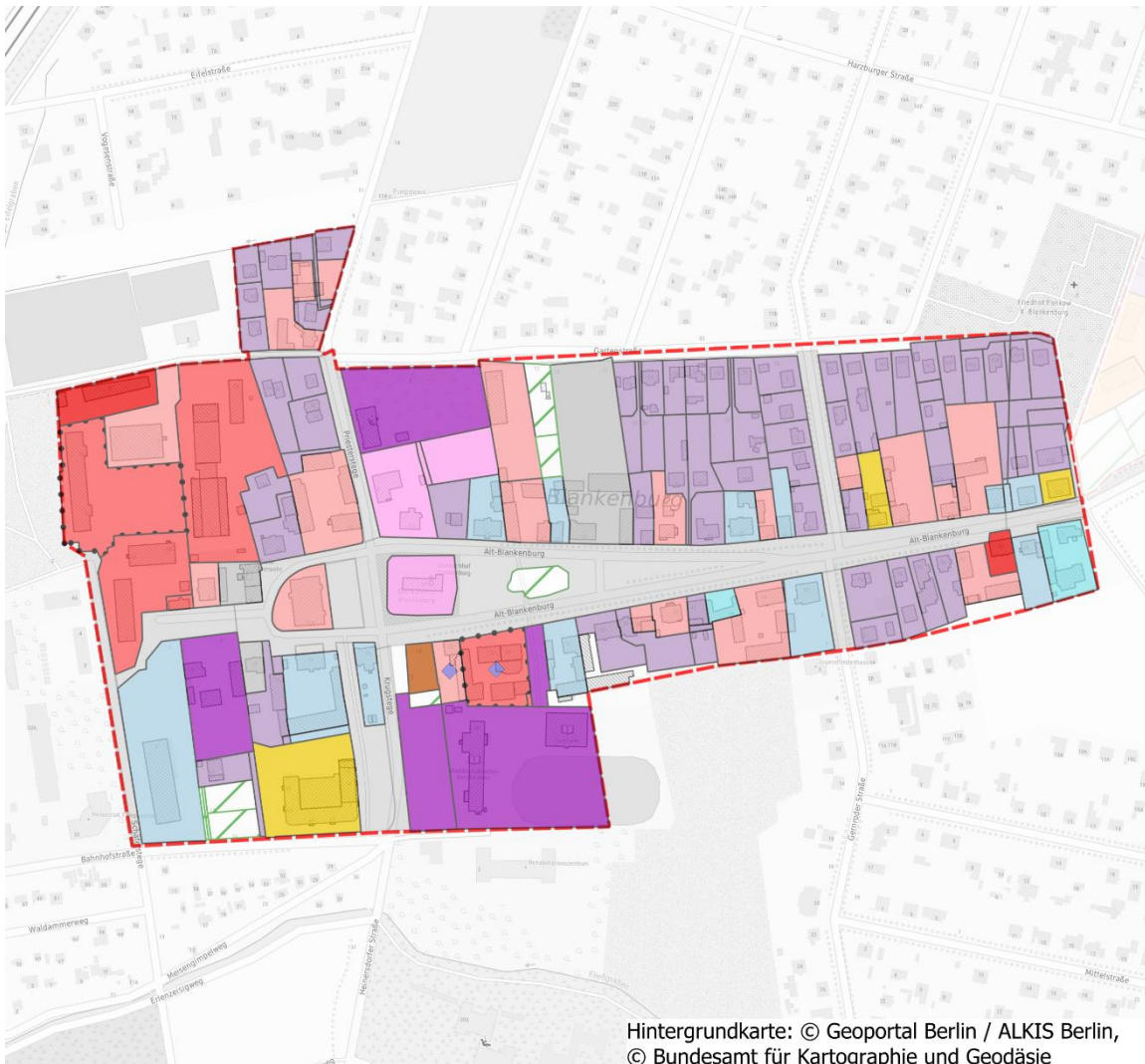
Hintergrundkarte: © Geoportal Berlin / ALKIS Berlin, © Bundesamt für Kartographie und Geodäsie